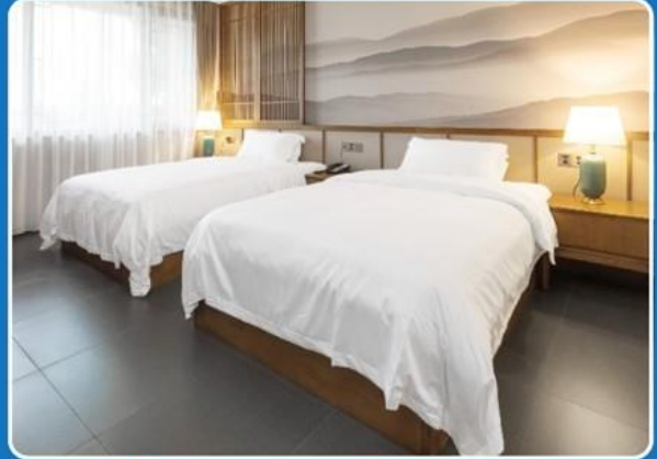
👤👤 TWIN (TWN)