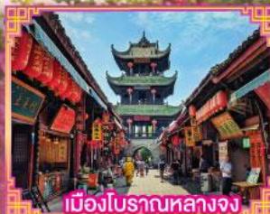
เมืองโบราณหลวงจีน