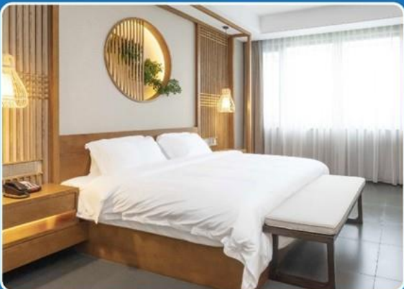
👤👤 DOUBLE (DBL)