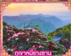
ภูเขาหมื่นช้างซาน