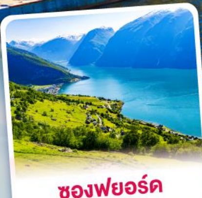
ช่องฟยอร์ด