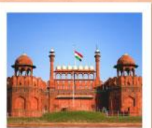
♥♥♥ Agra Fort