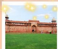
Ajmer Sharif Dargah