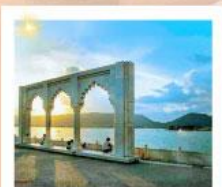
Ana Sagar Lake