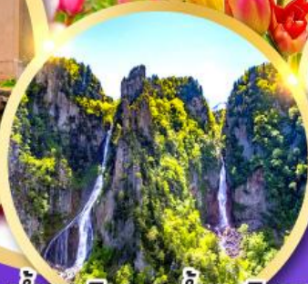
น้ำตกกิ่งกะ-น้ำตกริวเซ