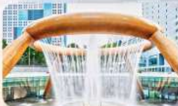
Fountain of Wealth