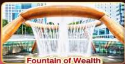
Fountain of Wealth