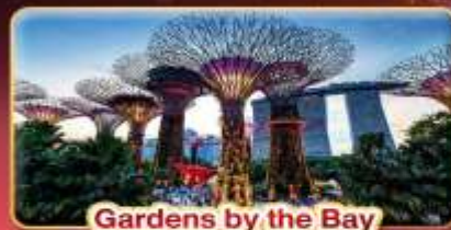
Gardens by the Bay