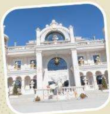
6 POP LAND