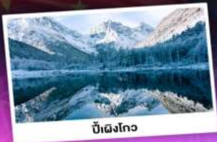
บี้ฝิงโกว

เทือกเขาแอลป์เมืองจีน "ภูเขาซีครุณี" ชมความสวยงามของอุทยานบี้ฝิงโกว