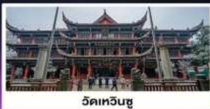
วัดเหวินซู