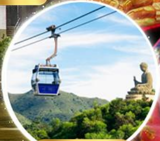
กระเช้าองปิง 360