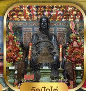
วัดปึกไต่