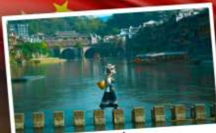
หมู่บ้านเฟิ่งทง

สุดคุ้ม!! พัก 5 ดาว ทุกคืน มนตร์เสน่ห์เมืองเก่า ริมสาងน้ำแจ่มใสแดน