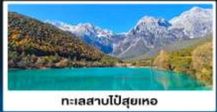
ทะเลสาบโป๋สยเหอ