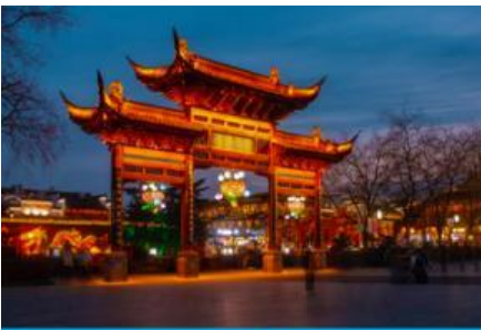
ย่านฟูจื่อเมี่ยว