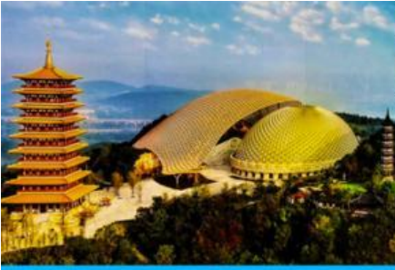
อุทยานหนิวสั่วซาน