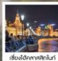
เซี่ยงไฮ้คาสสิกไนท์