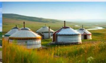
กู่งหว้าออร์ดอส