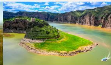
แกรนด์แคนยอนแม่น้ำเหลือง

*ทางบริษัทฯ ขอสงวนสิทธิ์ในการสลับโปรแกรมทัวร์ตามความเหมาะสมขึ้นอยู่กับสถานการณ์หน้างาน โดยคำนึงถึงผลประโยชน์ของลูกค้าเป็นสำคัญ