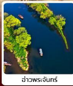
อ่าวพระจันทร์

• ไอลาร์ เชียงอิน ลั่วซิงตุน หอคอยดาวตงแห่งเจียงซี คุบเขาวังดาวจิ้งเซียนกู่ ดินแดนสวยดุจเทพนิยาย