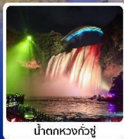
น้ำตกหวงกั๋วซู่