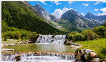
อุทยานแห่งชาติปี้เฟิงโกว