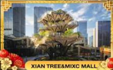
XIAN TREE&MIXC MALL