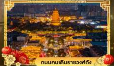
ถนนคนเดินราชวงศ์ถัง