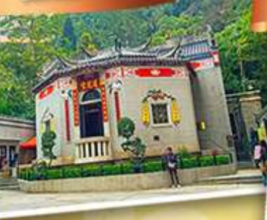
องค์อ้อยส้ม