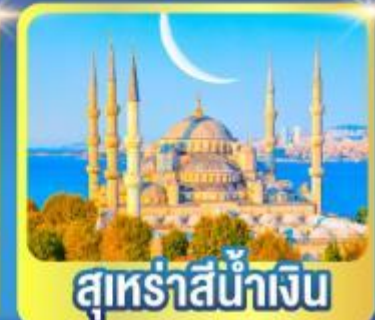
สุหรัสน้ำเงิน