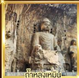
ถ้ำหลงเหมิน