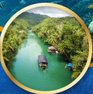
ล่องเรือแม่น้ำโลบ็อก