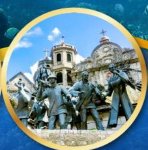
อนุสาวรีย์มรดกแห่งเซบู