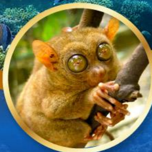
ลิงทาร์เซีย