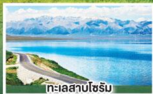
ทะเลสาบไซรัม