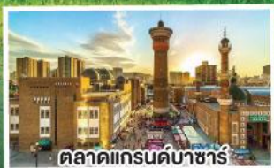
ตลาดแกรนด์บาซาร์