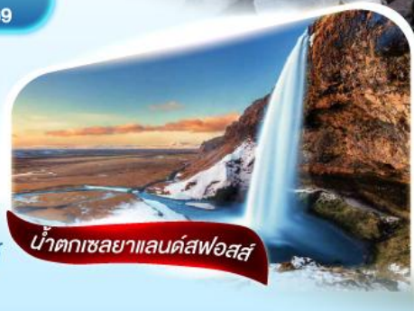
น้ำตกเซลยาแลนด์สฟอสส์