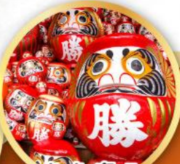
วัดคัตสึโอะอิ (วัดดามะ)

ชมความงามของกำแพงหิมะ เส้นทางสายอัลไพน์ทาทยามา (JAPAN ALPS SNOW WALL)