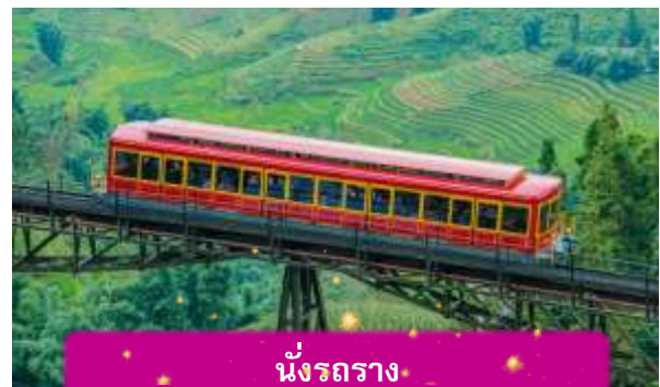
นั่งรถราง

เที่ยง บริการอาหารกลางวัน ณ ภัตตาคาร พิเศษ ... เมนูบุฟเฟ่ฟานซีปัน