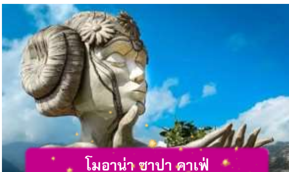
โมอาน่า ซาปา คาเฟ่

เย็น บริการอาหารค่ำ ณ ภัตตาคาร พิเศษ ... เมนูหม้อไฟแซลมอน + ไวน์แดง ที่พัก SAPA CHARM HOTEL ระดับ 4 ดาวมาตรฐานท้องถิ่น หรือเทียบเท่า