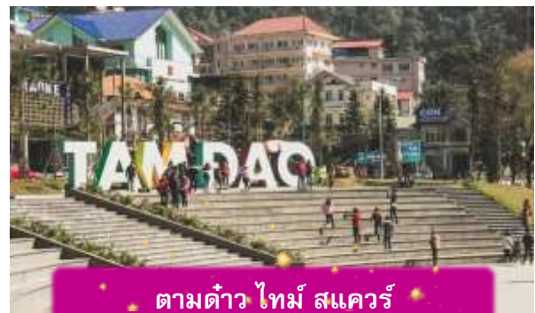
ตามด้าว ไทม์ สแควร์

อิสระท่าน ตลาดกลางคืนตามด้าว เมื่อแสงแดดลับขอบเขา เมืองบนดอยแห่งนี้จะค่อย ๆ เปลี่ยนบรรยากาศเป็นความคึกคักแบบเรียบง่าย ตลาดกลางคืนตามด้าวเต็มไปด้วยของกินพื้นเมือง กลิ่นหอมของหมูย่าง ไชนักรักษา และข้าวโพดย่างลอยคลุ้งไปทั่ว นักท่องเที่ยวเดินจับจ่าย พุดคุย และหยุดถ่ายรูปตามแสงไฟที่ประดับอยู่ทั่วตลาด บรรยากาศเป็นกันเองและอบอุ่น เหมาะกับการเดินเล่น ปิดท้ายวันด้วยความสุขเล็กๆ ๆ ที่สัมผัสได้