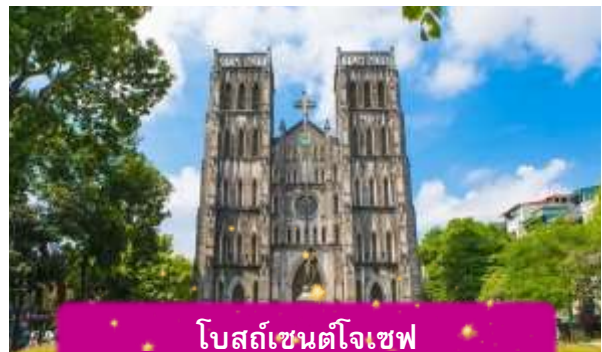
โบสถ์เซนต์โจเซฟ