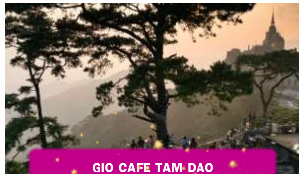
GIO CAFE TAM DAO

นำท่านเดินทางสู่ GIO CAFE TAM DAO คาเฟ่ชื่อดังบนยอดเขาที่เปลี่ยนกาแพ่ถ้วยหนึ่งให้กลายเป็นประสบการณ์สุดพิเศษ ด้วยทำเลที่มองเห็นวิวเมืองตามด้าวจากมุมสูง GIO Cafe จึงเป็นจุดหมายของทั้งสายถ่ายรูปและสายชิล ไม่ว่าจะเป็นระเบียบกระจกที่ยื่นออกไปกลางทะเลหมอก หรือที่นั่งริมหน้าต่างที่เห็นทิวเขาซ้อนกันไกลสุดสายตา ที่นี่ไม่ได้ขายแค่เครื่องดื่มดี ๆ แต่ขายความรู้สึกของการอยู่เหนือเมฆ ไม่รวมค่าเครื่องดื่ม