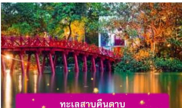
ทะเลสาบคินดาบ