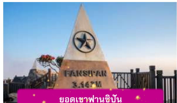
ยอดเขาฟานซีปัน