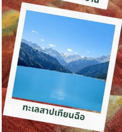
ทะเลสาปเทียนฉือ