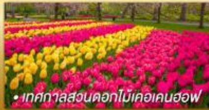
• เทศกาลสวนดอกไม้เคอเคนฮอฟ