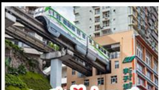
สถานีรถไฟทะเลสาบ

ชิง - อุโมงค์ - หงหยาดัง อุทยานเขานางฟ้าลงชิง สถานีรถไฟทะเลสาบ หมู่บ้านสามสะพานสวรรค์