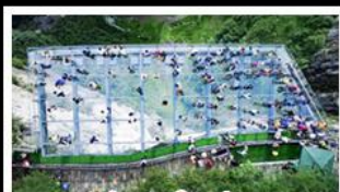
ระเบียงแก้วอยู่เฉย