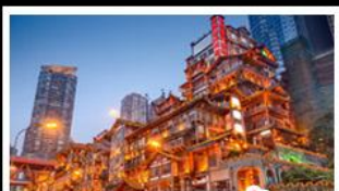
ตลาดเขงเขงฮง