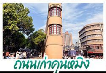
ถนนเก้าคุนหมิง