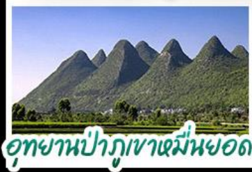
อุทยานปาฎูเขาเตมิ่งหมอด

ทิวทัศน์ตึกร้ายสายน้ำหลังห่อ - ล่องเรือทะเลสาบว่านผิงหู สะพานเทียนฮวาเจียง - อุทยานน้ำพุเทพาหมื่นยอด น้ำตกหวงกู่ - ถนนเก้าคุนหมิง เบบูพิซซ สุกี้หัด ปลารสเปรี้ยวเผ็ด ขบมันจัมซามสะพาน