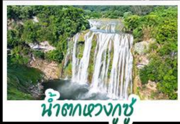
น้ำตกเซว่งกู่ซู่