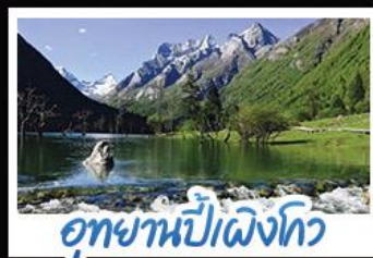
อุทยานปักธงโกว

ภูเขาสี่ดรุณี อุทยานจิวจ้ายโกว นั่งรถไฟความเร็วสูง น้ำพุไม่ใฝ่ตักSKP อุทยานปักธงโกว วัดต้าฉือ ถนนโบราณชอยกว้างชอยแคบ ช้อปปิ้งถนนไถ่กู่หลี่ + ถนนซุนซี้ลู่