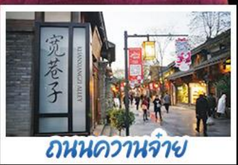
ถนนควานจ้าย