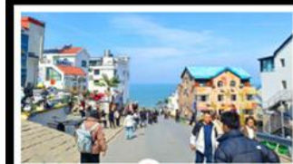
ถนนคอปเพิลิงหมายเลข 8

สัมผัสความยิ่งใหญ่ของ 4 เมืองสำคัญ ชิงเต่า - เยียนโก - เฟิงไห่ - เว่ยไห่ ปาต้ากวน - โบสถ์คาทอลิก - ตึกเก่าริมหา