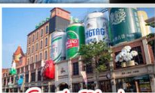
โรงแรมเป่ย์ชิ่งเต่า