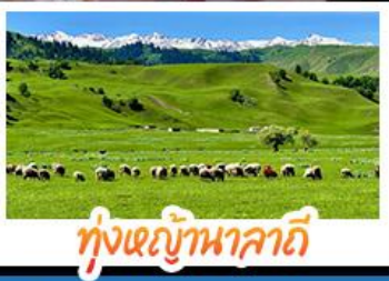
ทุ่งหญ้าานาลาถิ