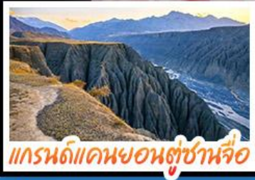
แกรนด์แคนยอนตู่ชานจื่อ