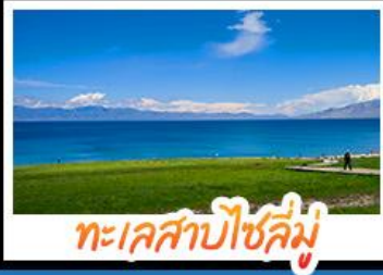
ทะเลสาบไซลีมู

หุบเขาดอกท้อ - ทะเลสาบไซลีมู แกรนด์แคนยอนตู่ชานจื่อ - ทุ่งหญ้าานาลาถิ