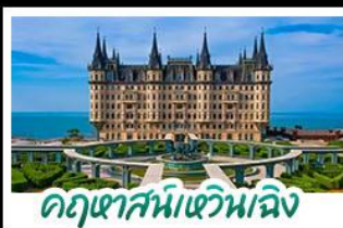
คฤหาสน์เหวินเจิง

เมืองท่าชิงเต่า - คฤหาสน์เหวินเจิง เบียร์ชิงเต่า + อาหารทะเล สตรีทอาร์ต สตูดิโอจิบลิ