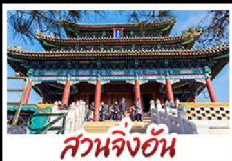
สวนจิ่งอัน