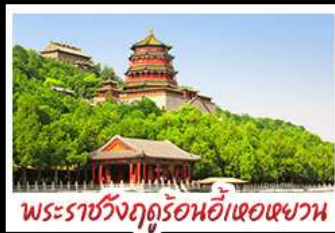
พระราชวังฤดูร้อนอ้าหอยวน

มือพิเศษ เปิดปีกที่ สุกม็องโกล MICHELIN GUIDE ร้าน TAO TAO JU