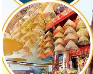
ไหว้พระวัดดัง