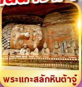
พระแกะสลักหินต้าจู๋