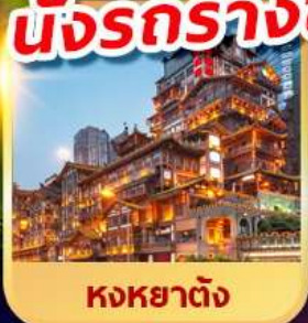
หงหย้าต้ง