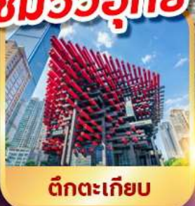
ตึกตะเกียบ