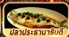
ปลาประรานาภิรมดี