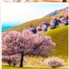
ทุ่งดอกอัลมอนต์