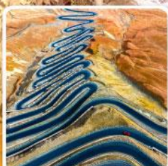
ถนนผานหลงกู่ต้าว