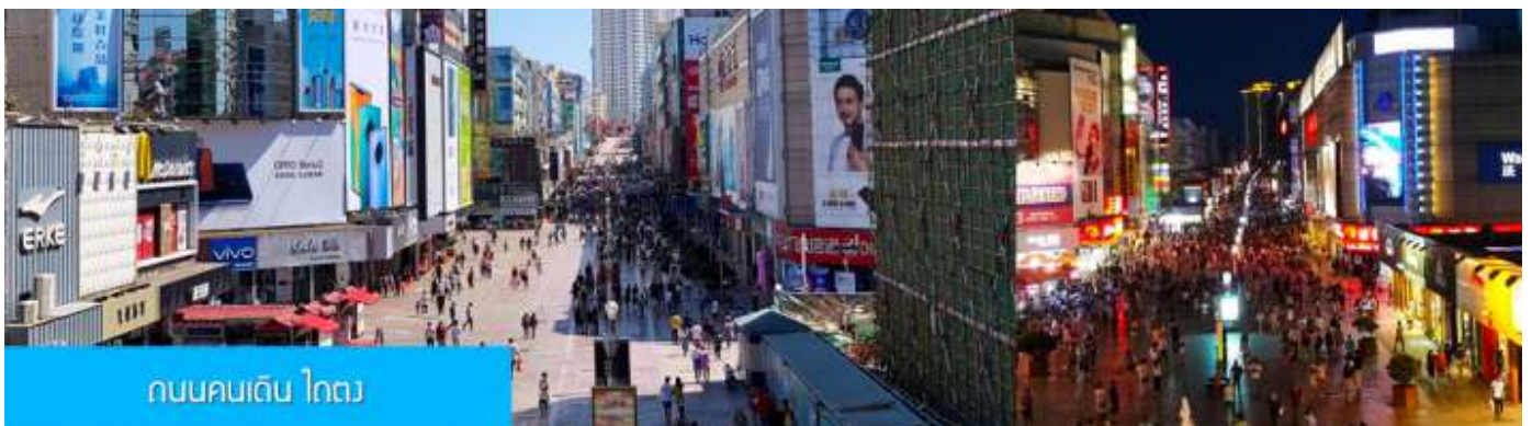
ถนนคนเดิน ไถตง

จากนั้นนำท่านเที่ยวชม โรงเบียร์ชิงเต่า 青岛啤酒博物馆 พิพิธภัณฑ์เบียร์ที่ขึ้นชื่อของเมืองชิงเต่า ซึ่งเป็นเบียร์ยี่ห้อแรกที่ผลิตขึ้นในประเทศจีน ชมเบียร์ คอลเลกชันที่มียี่ห้อหลากหลายที่สุดของโลก และชมการจัดแสดงภาพและวิดิทัศน์เกี่ยวกับวิวัฒนาการของเบียร์ ขั้นตอนการผลิตและอื่น ๆ ที่เกี่ยวข้อง พร้อมชิมเบียร์ชิงเต่า ซึ่งเป็นเบียร์ที่ขายดีที่สุดยี่ห้อหนึ่งของจีน.. (ชิมเบียร์ชิงเต่าท่านละ 1 แก้ว รับประทานอีก 1 ขวดเล็ก ตอนเดินออก)