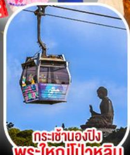
กระเช้าองปัง พระใหญ่ไผ่หลิน