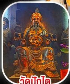
วัดปิกโต