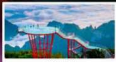
ภูเขา 7 ดาว