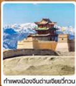
กำแพงเมืองจีนด่านเจี๋ยวี่กวน