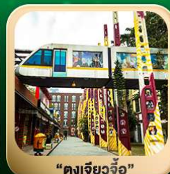
“ตงเจียวจื่อ”