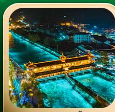
“สะพานหนานเฉียว น้ำคาสีฟ้า”