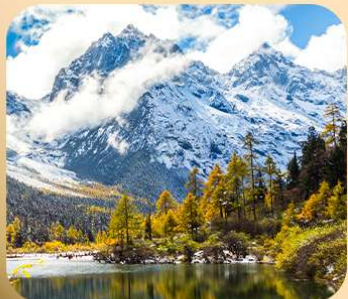
“ปี่ผิงโกว”

ชมธรรมชาติ 2 อุทยานขึ้นชื่อ อุทยานภูเขาสี่ดรุณี + อุทยานปี่ผิงโกว สะพานหนานเฉียว • ถนนคนเดินไท่กู่หลี่ + ซุนซีลู่ + Pop Mart • ตงเจียวจื่อ