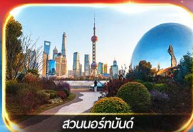
สวนนอร์มัลด์