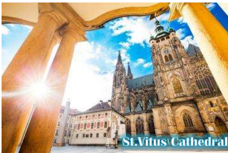
St. Vitus Cathedral