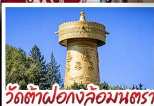
วัดต้าฝอ กงล้อมณฑล