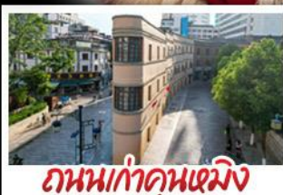
ถนนเก่าคุณหมิง