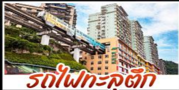
รถไฟฟ้า-คูตัก