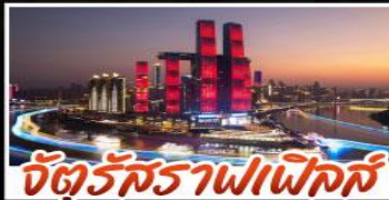
จัตุรัสราฟเฟิลส์