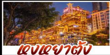
แสงอาคารต่าง

สัมผัสประสบการณ์เที่ยวจีนแบบเต็มอิ่ม ทั้งความล้ำสมัยของมหานครฉงชิ่ง และความงดงามตระการตาของธรรมชาติที่จุหล่ง ทุกการเดินทางเต็มไปด้วยความสะดวกสบายและคุ้มค่าเกินราคา!