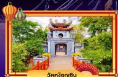
วัดผิงอิซิน