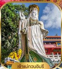
เจ้าแม่กวนอิม พลัสเบย์