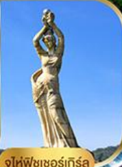
จูไห่ฟิชชอร์ทิวรา