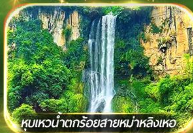
หุบเขาน้ำตกร้อยสายหม่าหลิงเหอ

ชมป่าภูเขาหมื่นยอด, เที่ยวหมู่บ้านโบราณหลินปู้อี ล่องเรือทะเลสาบว่างเฟิงหู, ชมสวนดอกไม้ตามฤดูกาล