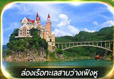
ล่องเรือทะเลสาบว่างเฟิงหู